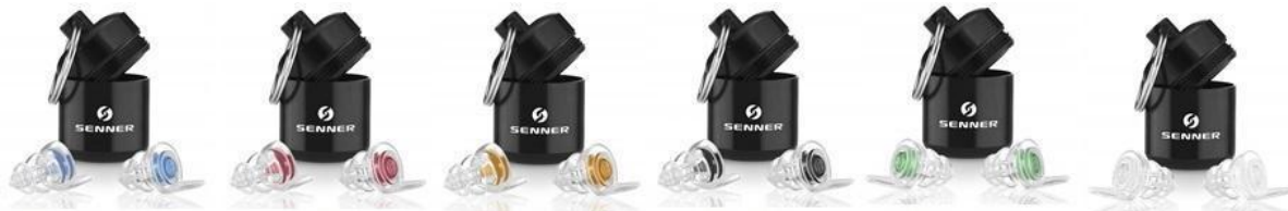
MusicPro „Soft“ WomenPro WorkPro MotoPro KidsPro Plug PartyPro