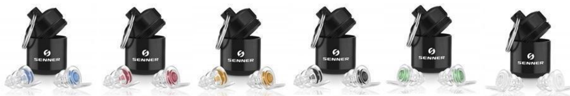
MusicPro „Soft“ WomenPro WorkPro MotoPro KidsPro Plug PartyPro