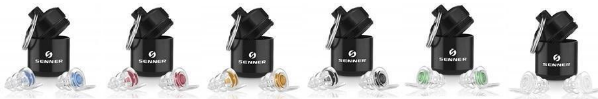
MusicPro „Soft“ WomenPro WorkPro MotoPro KidsPro Plug PartyPro