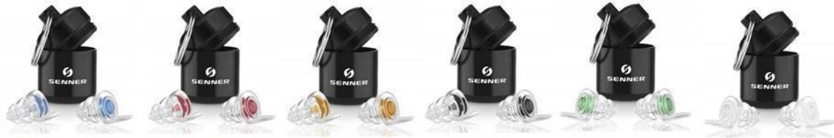
MusicPro „Soft“ WomenPro WorkPro MotoPro KidsPro Plug PartyPro