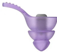
fioletowy Filtr szary