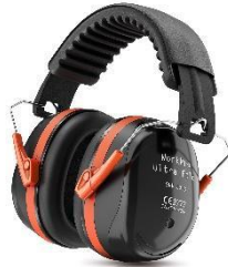
WorkPro Ultra Fold