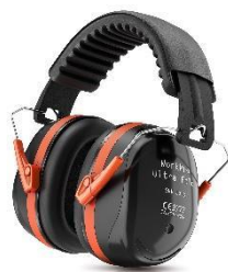
WorkPro Ultra Fold