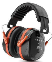
WorkPro Ultra Fold