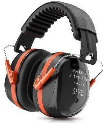
WorkPro Ultra Fold