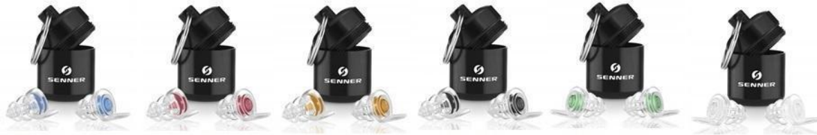
MusicPro „Soft“ WomenPro WorkPro MotoPro KidsPro Plug PartyPro