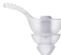
przezroczysty Filtr przezroczysty