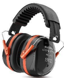
WorkPro Ultra Fold