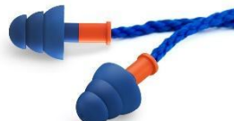
with connecting cord