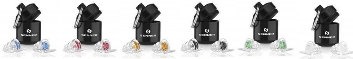
MusicPro „Soft“ WomenPro WorkPro MotoPro KidsPro Plug PartyPro